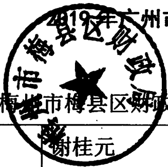
2019年广州市对口帮扶省定贫困村市级财政资金划拨情况表