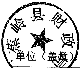
2019 年广州市对口帮扶省定贫困村市级财政资金划拨情况表