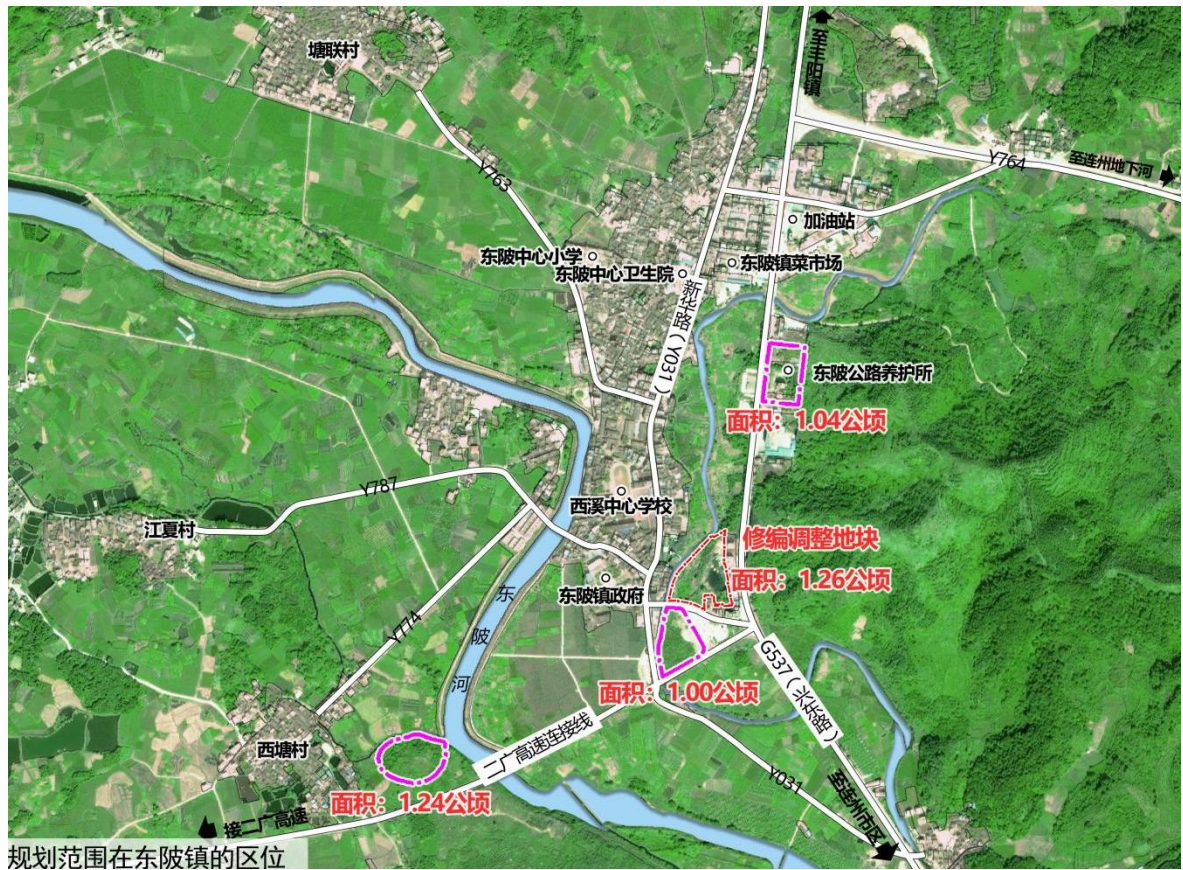
图 1 修编范围区位示意图